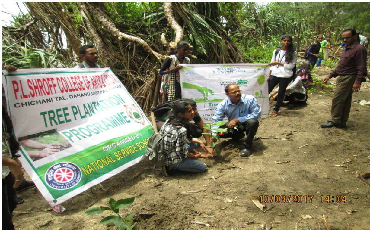
6. Tree Plantation awareness Rally by Girls NCC Unit